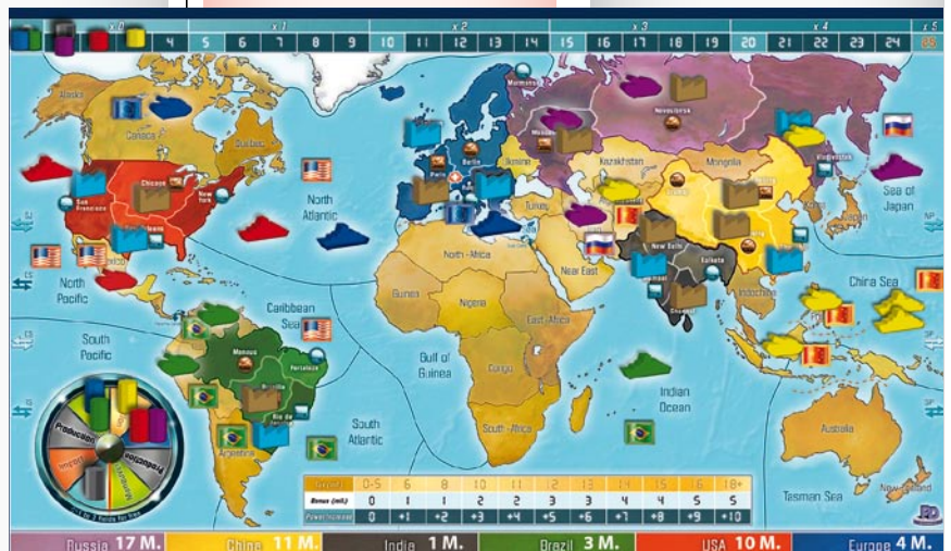
After sixth round, third move / 6. Runde, nach Indiens Zug

Reminders: The investor card is also activated when the "Investor" space is skipped on the rondel. Fleets may move "around the world", for instance a Russian fleet from Sea of Japan could enter the North Pacific.