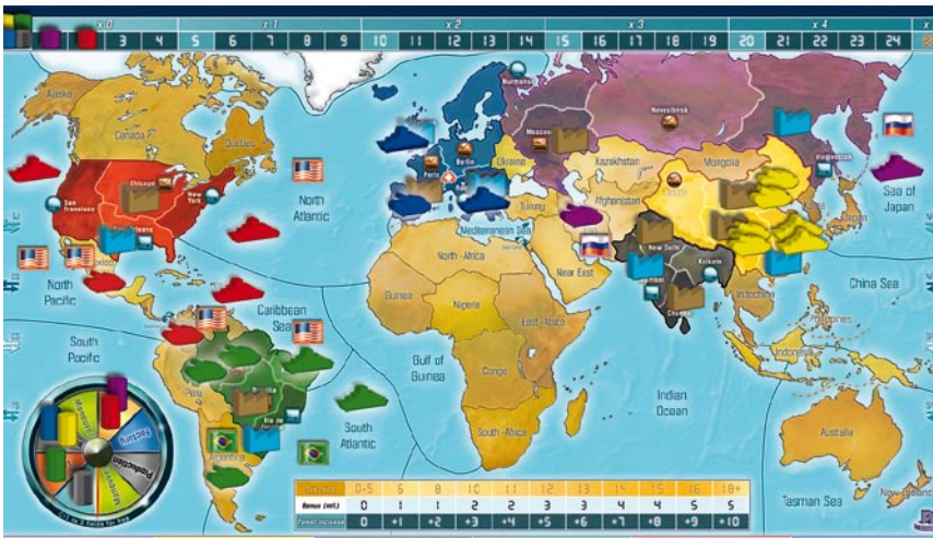
After the fourth round / Nach der 4. Runde