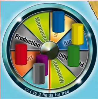
Rondel after the first round Rondell nach der 1. Runde

6. The last nation in the round to move is Europe , controlled by Anton, the only European investor. He puts the blue nation marker onto the "Taxation" space. The European tax revenue is 4M (4M from 2 factories, no flags yet). Europe's treasury now owns 8M. As there are no European military units, Europe does not have to pay any soldiers. The tax chart shows that this results in no bonus for the government and no increase in power points.